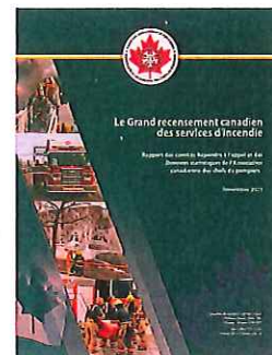
Le rapport du Grand recensement canadien des services d'incendie

La pétition e-4594 en faveur de l'augmentation du crédit d'impôt pour les pompiers volontaires et les volontaires en recherche et sauvetage (conformément au projet de loi C-310)